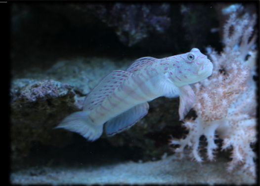
Nom scientifique: Cryptocentrus pavoninoides Nom commun: Gobie