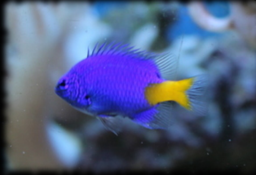
Nom scientifique: Chrysiptera Parasema Nom commun: Demoiselle à queue dorée

Dimension (L×ℓ×h): 1,5×0,8×0,7m 3 Volume réel: 700 L PH: 8 ; Température: 25°C Eclairage: 8×T5 pendant 10 hr / jr Filtration: 1 décantation externe Nourriture: moules, crevettes, artémias