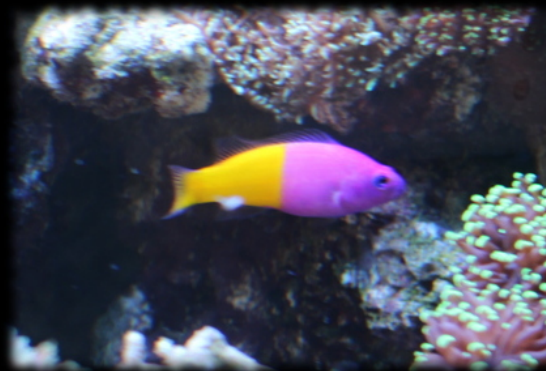
Nom scientifique: Pictichromis paccagnella Nom commun: Vanille fraise