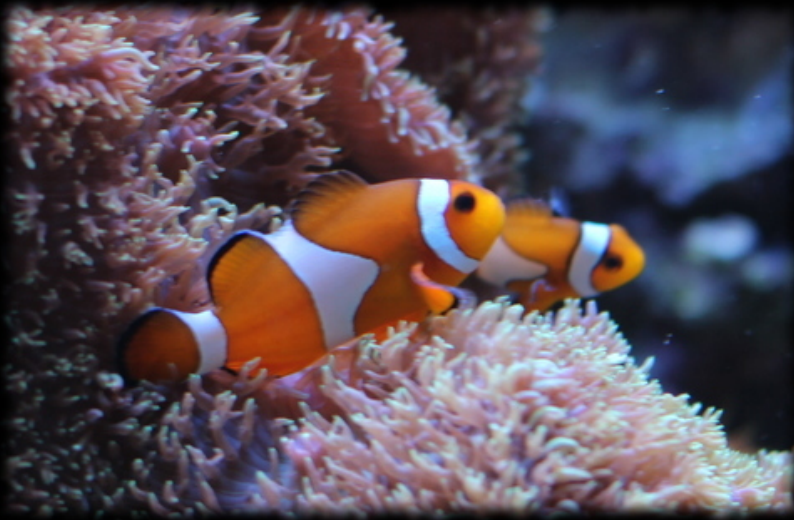
Nom scientifique: Amphiprion Oscellaris Nom commun: Poisson clown (Némo)