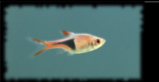
Trigonostigma heteromorpha (Rasbora arlequin)

L'autre particularité de ce gourami est de se reproduire en créant un nid de bulle où les œufs sont couvés et protégés. C'est le mâle qui s'occupe de sa progéniture.