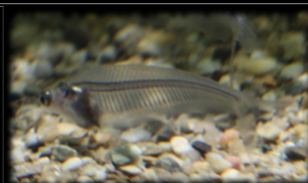
Kryptopterus bicirrhis (Silure de verre)