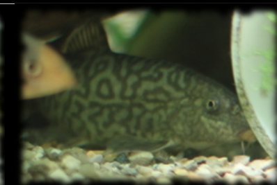
botia lohachata (loche léopard)