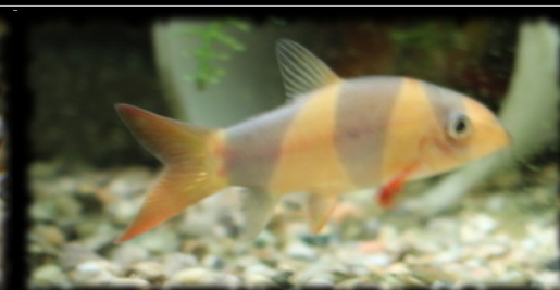
chromobotia macracanthus (loche clown)