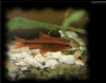
Puntius titteya (Barbus cerise)